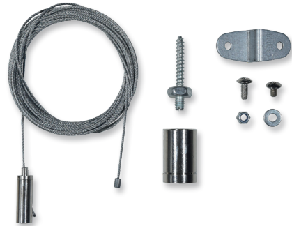
1 Set = 2 Seile mit Anbringungsmaterial 1 Set = 2 cables with mounting material