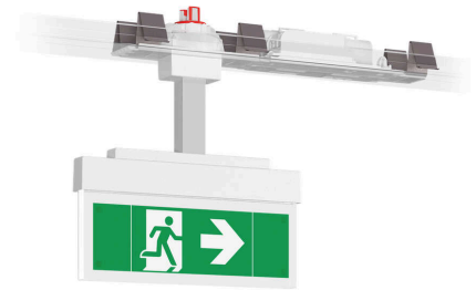
Abbildung zeigt Zubehör

Schlichte und moderne Rettungszeichenleuchte aus hochwertigem Aluminium für die Montage in dafür freigegebene Lichtband-Geräteträger. Über den eingebauten Rastmechanismus kann die Leuchte in 30°- bzw. 45°-Schritten um die eigene Achse gedreht werden. Gegen Aufpreis kann die Leuchte werkseitig fertig montiert in durch uns zugekaufte und bearbeitete Lichtband-Geräteträger bezogen werden (Details siehe nachfolgende Tabelle). Im Leuchtenpreis ist pro Leuchte ein Piktogramm-Vorsatzfolien-Set - Pfeil links/rechts/unten/oben/blind (Erkennungsweite 10 m) enthalten. Die 10 mm Lichtlenkscheibe wird mit einer 2 Watt LED-Leiste ausgeleuchtet. ACHTUNG! Die angegebene Schutzart bezieht sich auf die Leuchte (raumseitig) im eingebauten Zustand. Bei Einbau in einen Geräteträger mit abweichender Schutzart gilt die jeweils niedrigere Schutzart.